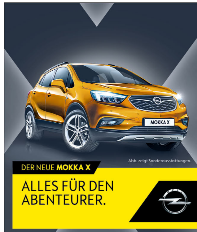
Abb. zeigt Sonderausstattungen.