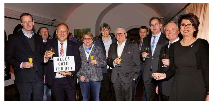
EHRENAMT WIRD BELOHNT