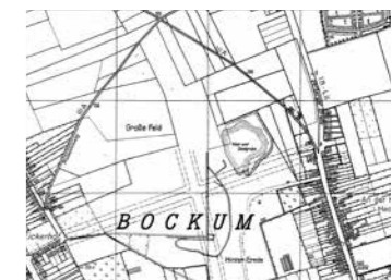
Die Pläne und Luftbilder aus den 1950er und 1960er zeigen das Entstehen des Badeszentrums.

Fotos: © Stadt Krefeld Fotos: Badeszentrum3, DGK5_1958_Baggersee, DGK5L_1959_Baggersee, DGK5L_1968_Badeszentrum