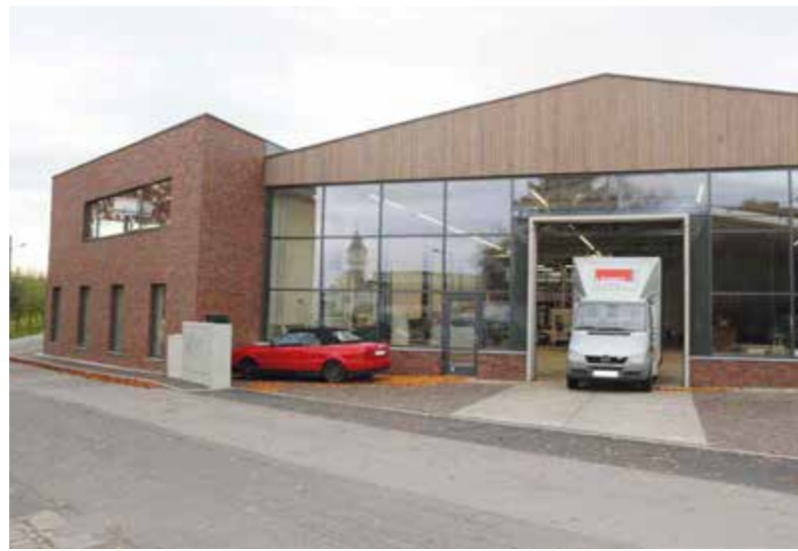
Die neue Betriebsstätte von Legno an der Krüserstraße ist eine ehemalige Lagerhalle von Laufenberg. Das linke Gebäude wird bald als neues Büromodul von Legno im Erdgeschoss genutzt. Die obere Etage (140 qm) wird gerne vermietet. Bei Interesse bitte unter 1518020 melden.