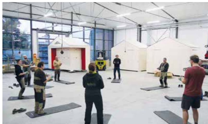
Jede Woche Dienstag findet in der neuen Betriebsstätte „Rücken-Fit“ mit einer Trainerin von Salvea statt.

Hütten als raffinierten Film mit Weihnachtsmann sehen möchte, der sollte auf www.legno.de klicken. (djm)