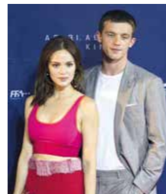
Emilia Schüle und Jannis Niewöhner.

Er stand bereits mit zehn Jahren in einer Tatort-Folge vor der Kamera und hat es längst zum populären Teenie-Schwarm und vielbeachteten Jungschauspieler gebracht.