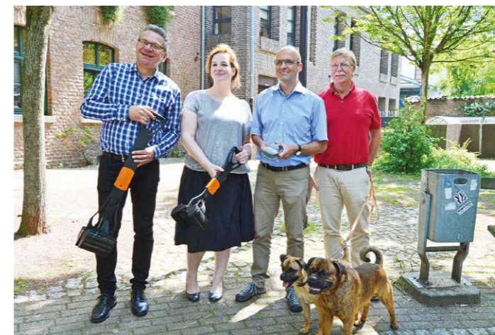
Mit besonderen und handlichen Greifgeräten kann der Hundekot eingetütet werden.

Viele neue Informationen zur gezielten Beseitigung von Hundekot hat die Sauberkeit in der Stadt Tönisvorst nachhaltig verbessert.