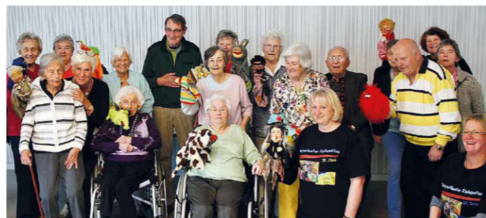
Viel Spaß mit dem „Kaspertheater Zipfelmütze“ im Demenzcafé der Ev. Kirchengemeinde St. Tönis.