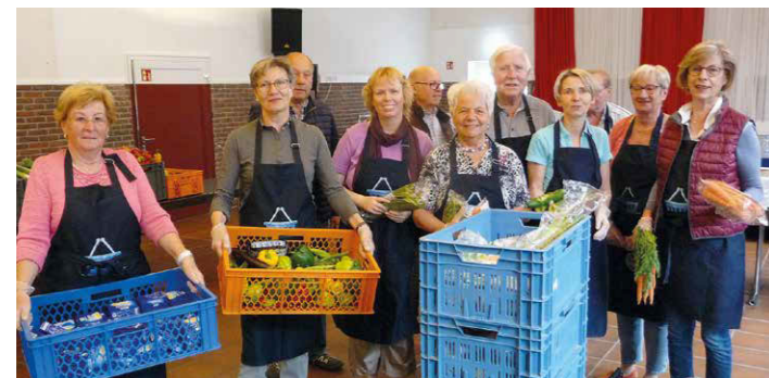
Fleißige ehrenamtliche Helfer bei der Ausgabe der Grundnahrungsmittel im Marienheim.