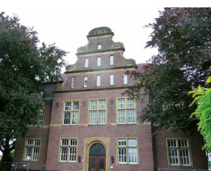
Das alte Rathaus in Vorst nimmt die Technische Verwaltung auf.