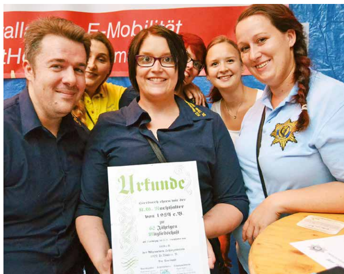
MALEREI DER SINNE