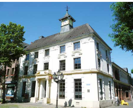
Im Historischen Rathaus an der Hochstraße kann man heiraten und Bücher ausleihen. Im Ratssaal tagt der Rat der Apfelstadt.