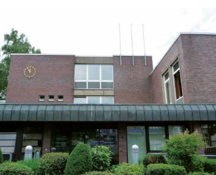
Die meisten Dienststellen der Stadtverwaltung sind mit dem Bürgermeister an der Bahnstraße untergebracht.