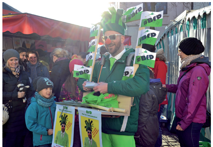
Der B.R.Eetlooksman hatte schnell auf dem Hülser Wochenmarkt viele Fans um sich geschart.

land, kurz BfD genannt, soll mehr Mut zur Zufriedenheit zurück bringen!“ „In Hüls ist ja alles super. Hüls ist zufrieden. Und das wollen wir auf ganz Deutschland übertragen. Denn in der Republik wird zu viel gemeckert und gezetert“, sagt „der Mann fürs Kanzleramt“. Mit Breetlook-Schnäpschen für Erwachsene und Breetlook-Bonbons für Kinder hat der B. R. Eetlooksman auf dem Hülser Markt am 21. Januar viele Fans schnell überzeugen können. (qpr)