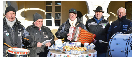
Vorstandsmitglieder vom Komitee Karnevalzug Hüls 1979 e.V. machten mit Live-Musik auf ihre zwei Sitzungen aufmerksam.