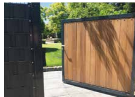
Ein hochwertiges Tor aus Metall und Holz ist stabil und formschön.

dem Schweißen nicht mehr gegen Rost behandelt und anschließend nicht pulverbeschichtet. Das sehe zwar gut aus, biete aber keinen langen Schutz. „Unsere Stahlzäune sind entsprechend behandelt und unsere Holzzäune bestehen aus druckimprägniertem wetterfestem Qualitätsholz mit 20 Jahren Garantie“, erläutert der Fachmann. Auch eine Kombination aus Stahl und Holz wird gerne gewählt. Der jüngste Trend seien Aluminium-Sichtschutzzäune, weil sie schick aussehen, individuell herstellbar sind und in Kombination mit Materialien