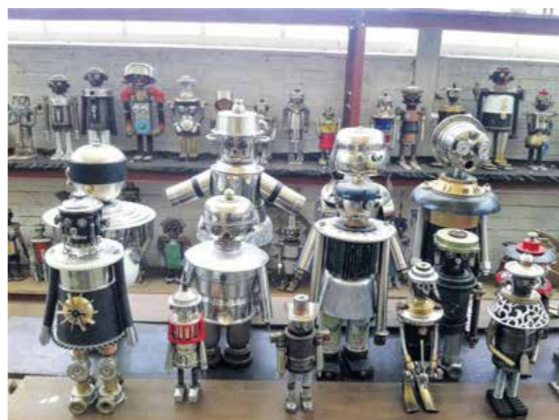
Jede Figur ist ein Unikat.

Erscheinen von Hüls life zeigt das Stadtfernsehen KR-TV einen Bericht über den Künstler. (wop)