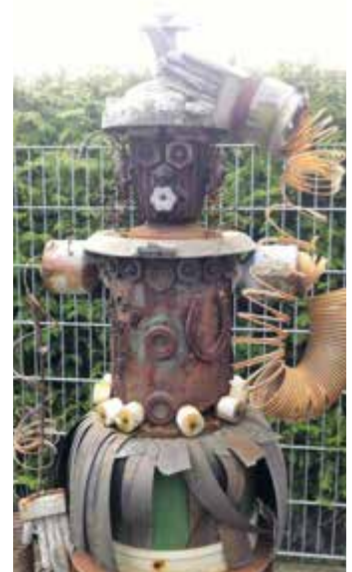
Kunst im Garten

mit Erlaubnis seines Arbeitgebers leicht. Heute ist er fast 79 Jahre alt und seine „Lieferanten“ sind zumeist Hausfrauen. „Das war einmal ein Staubsauger, alles wunderschöne Einzelteile“, gerät er ins Schwärmen. Die ausgeschlachtete Wäscheschleuder gehörte seiner Tante. In zwei Werkstatthallen, ehemals Gewächshäuser der Gärtnerei seiner Frau, lagert er unzählige Teile aus verschiedenen Metallen. Alte Mülleimer, Druckbehälter oder Kochtöpfe dienen als Körper für seine Figuren, Bratpfannen bilden Rumpf und Schultern, aus Rohren entstehen Hälse und Beine, aus Geldbomben von der Sparkasse Arme, aus Schalen Kopfbedeckungen, aus Druckanzeigern Augen und aus Bügeleisen Füße. Auch der Humor kommt nicht zu kurz. Sein Motto: „Spaß muss sein.“ Die