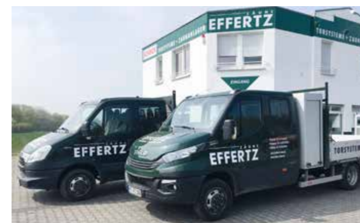
Die Firmentransporter bringen die Monteure schnell zum Kunden.