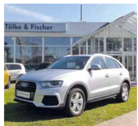
Das Autohaus von TöFi in Hüls hat rund 50 Fahrzeuge aktuell im Angebot.

schließlich sein Auto aus der Inspektion abholt, erhält er es blitzsauber aus der TöFi-eigenen Waschanlage zurück. Möchte der Kunde kein Fahrzeug ausleihen, kann er den kostenfreien Hol- und Bringservice nutzen, für den allein vier Mitarbeiter im Einsatz sind. „Beim Service sind wir die Nummer Eins in Hüls“, sagt Rinsch und legt mit seinem Team Wert auf die Qualitätsmerkmale hilfsbereit und flexibel bei Sonderwünschen. „Langjährige Kunden wissen, dass sie bei uns gut behütet sind, weil wir den Service-Gedanken leben.“ Stolz ist der Betriebsleiter auch auf die Anerkennung als Economy-Service-Partner von Volkswagen – ein spezielles Reparatur- und Wartungsangebot für Fahrzeuge älteren Baujahrs. Mittelfristig ist eine Erweiterung des Standorts in Hüls geplant, unter anderem sollen mehr Parkplätze geschaffen werden. „Der Team-Gedanke unter den Mitarbeitern kommt in unserem familienfreundlichen Betrieb auch den Kunden zugute“, sagt Rinsch, der privat gerne mit dem Motorrad unterwegs ist. Das zeige sich selbst