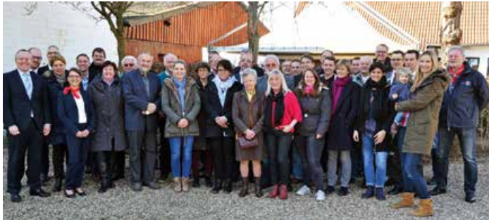
Delegationen aus 77 gemeinnützigen Vereinen freuten sich mit dem Leitungsteam der Sparkasse Krefeld über die großzügige finanzielle Unterstützung.

Die Sparkasse Krefeld hatte am 20. März Gäste von 77 Vereinen aus ihren Geschäftsbereichen Kempen, St. Hubert und Grefrath ins Auffelder Bauerncafe nach Grefrath-Oedt eingeladen.