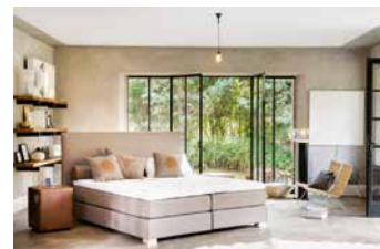
So sieht ein Wunschbett aus.

tifizierten Naturmaterialien. Die Stoffe bis hin zum Sattelleider kommen aus italienischen Designerstudios. „Wenn wir unsere Produkte als preiswert bezeichnen, heißt das, dass die Qualität ihren Preis wert ist.“ In den großzügigen Bettenstudios finden die Kunden eine ansehnliche Auswahl an Modellen vor, darunter auch ein frei gestaltbares, elektrisch bewegbares Reha-Bett. „Unser Familienbetrieb mit einem kreativen Team aus sechs Beratern und Monteuren setzt ganz auf Qualität und zufriedene Kunden.“ Diese kommen vom Niederrhein und viele auch aus Holland. (wop)