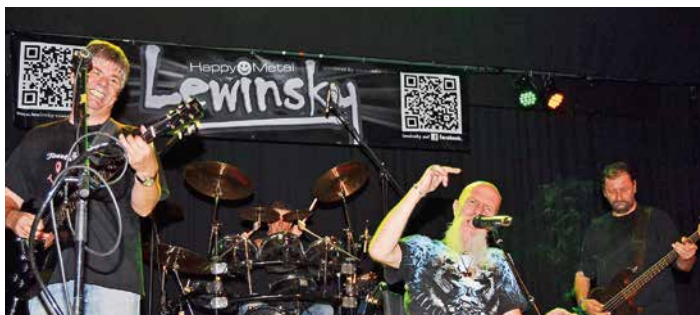
Die Happy Metal und Rockcoverband Lewinsky ist das Jubiläums-Highlight bei Rock am Rathaus in St. Tönis.

Die Sommer-Party „Rock am Rathaus“ kann am Samstag, 21. Juli, in Tönisvorst ganz groß gefeiert werden.