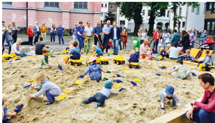
Wie in Kempen auf dem Kirchplatz wird es auch in St. Tönis einen großen Sandkasten geben.

Der Verein Kinderhilfe Apfelblüte Tönisvorst bietet zum Start der Sommerferien eine tolle Aktion für Kinder auf dem Alten Markt an.