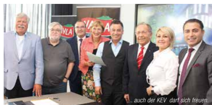
... auch der KEV darf sich freuen.