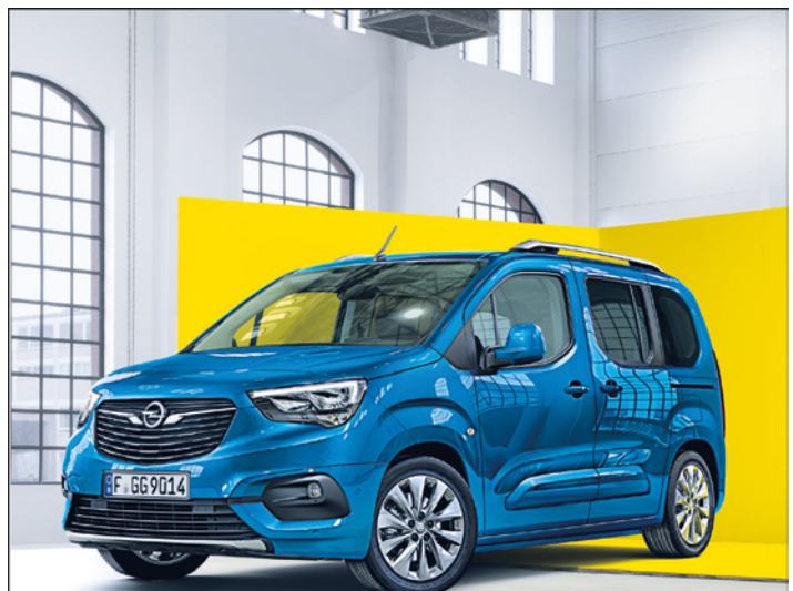
Abb. zeigt Sonderausstattungen.