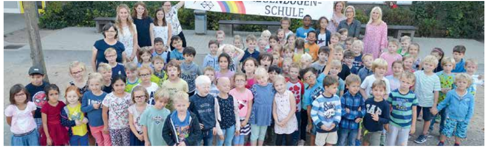
Eulen, Raben, Bären, Frösche, Eichhörnchen, Maulwürfe und Robben sind die Maskottchen der I-Dötze in den sieben verschiedenen Klassen