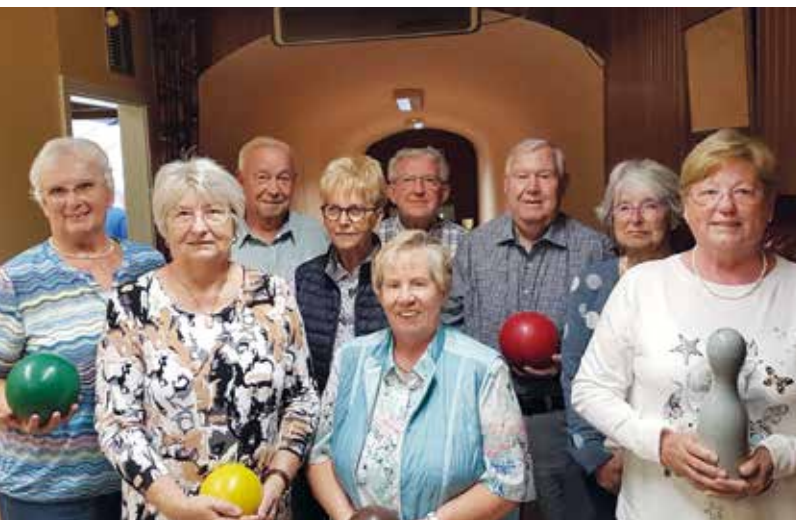
Alle Kegelclubmitglieder beim letzten Kegelabend, dem Jubiläumskegeln in der Gaststätte Boves auf der Krefelder Straße in St. Tönis.

ler verringert, sondern auch die ehemals über 60 Gaststätten, die meist mit einer Kegelbahn für das gesellschaftliche Miteinander in St. Tönis ausgestattet waren. Neben den Kegelabenden werden auch Kegeltouren organisiert, zum Beispiel nach Frankreich und Spanien. Zum Jubiläum ging es nach Kroatien. (red)