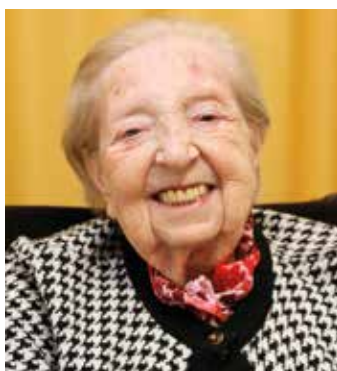
Die rüstige Jubilarin in ihrem Zimmer im Lazarus-Haus.

Mann“ sicherlich darauf wartet, das Mantelteil vom Heiligen Martin überreicht zu bekommen. Der Tag wird seinen Abschluss beim traditionellen Martinsball um 20 Uhr im Forum finden. (red)