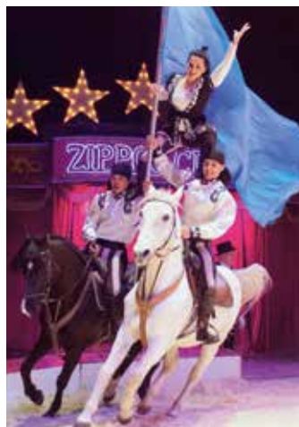
Die Reitershow der Khadikov Truppe.

gramms „FANTASTICO“. „Wir feiern 2019 die 250-jährige Geschichte des klassischen Circus. Die neue Show ist eine Hommage an dieses zauberhafte Kulturgut“, berichtet Direktor Reinhard Probst. Besonders stolz ist Probst auf die Reitershow der Khadikov Truppe. Im temporeichen Galopp zeigen die tollkühnen Reiter waghalsige Tricks auf den Rücken der Pferde. Selbstverständlich wird auch die 7. Produktion des Weihnachtscircus von dem famos aufspielenden