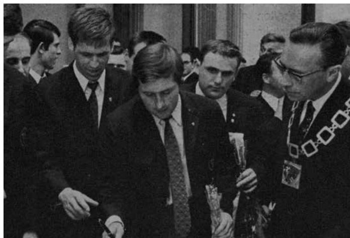
Deutscher Meister TV Oppum vor 50 Jahren.

Dann rufen Sie uns an: Telefon 02151 5162616