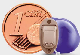
Abbildung exemplarisch, weitere Bauformen erhältlich. Angebot gilt für je ein Signia 1px Hörgerät und nur für gesetzlich Versicherte. Zzgl. 10,- € gesetzliche Zuzahlung pro Ohr bei Vorlage einer ohenfachärztlichen Verordnung. Für privat Versicherte erstellen wir gerne ein Angebot auf Anfrage. Gültig bis 31.01.2020

OTON Die Hörakustiker Hörakustik Derouaux GmbH