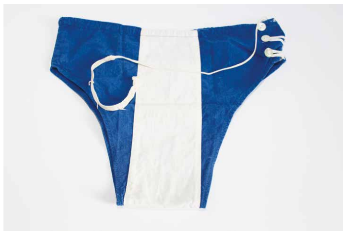
Der Badehosen-Look des Arndt Gymnasiums vor 60 Jahren.