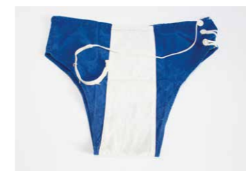
Der Badehosen-Look des Arndt Gymnasiums vor 60 Jahren.

Für vom Herausgeber gestaltete Anzeigen, Logos, Texte und Fotos besteht Urheberrecht. Eine Weiterverwertung bedarf der Rücksprache und schriftlichen Genehmigung. Die inhaltliche Verantwortung von gelieferten Anzeigen, Texten, Logos und Fotos obliegt dem Inserenten. Für unverlangt eingesandte Manuskripte und Fotos übernimmt der Herausgeber keine Gewähr. Der Herausgeber behält sich vor, namentlich gekennzeichnete Berichte, die nicht unbedingt die Meinung der Redaktion widerspiegeln, zu veröffentlichen. Ein Veröffentlichungsanspruch und Rücksendung auf unverlangt eingereichte Manuskripte und Fotos besteht grundsätzlich nicht. Irrtümer vorbehalten.