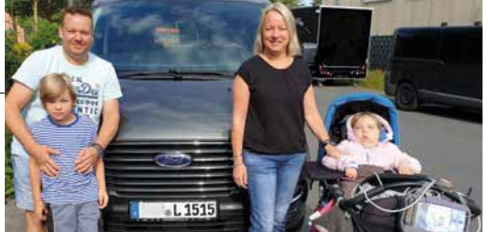
Fam. Geier.

Mo.-Fr.: 9-13 Uhr und von 14-18.30 Uhr, Sa.: 9-14 Uhr