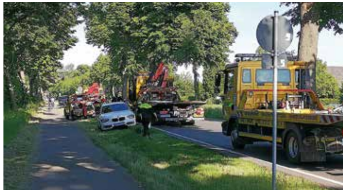
10 im absoluten Haltverbot abgestellte Pkw wurden in den Morgenstunden des 21. Mai auf der Hülser Straße abgeschleppt.