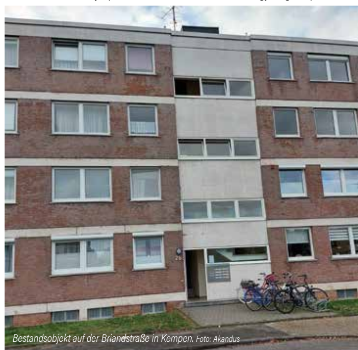
Bestandsobjekt auf der Briandstraße in Kempen.

Weitere Informationen auch unter www.akandus.de