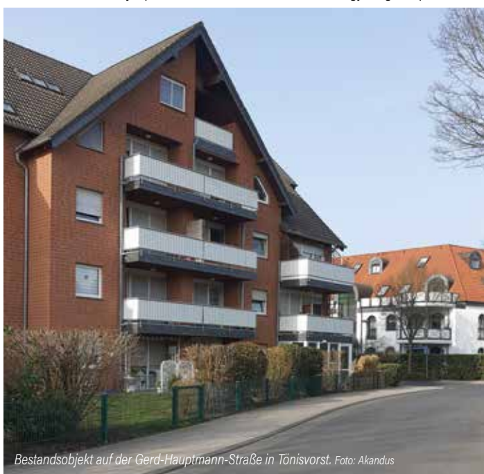
Bestandsobjekt auf der Gerd-Hauptmann-Straße in Tönisvorst.

Weitere Informationen auch unter www.akandus.de