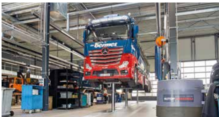
Lkw-Werkstatt mit Stempelhebebühne für komplett beladene Sattelzüge bis 95 Tonnen.