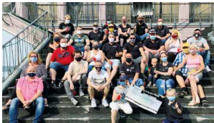
Der „Opel Charity Event“ des Clubs Opel Custom Driver brachte am Ende des Tages eine Spende von mehr als 7000 Euro für die Unterstützung von Familien mit krebskranken Kindern.