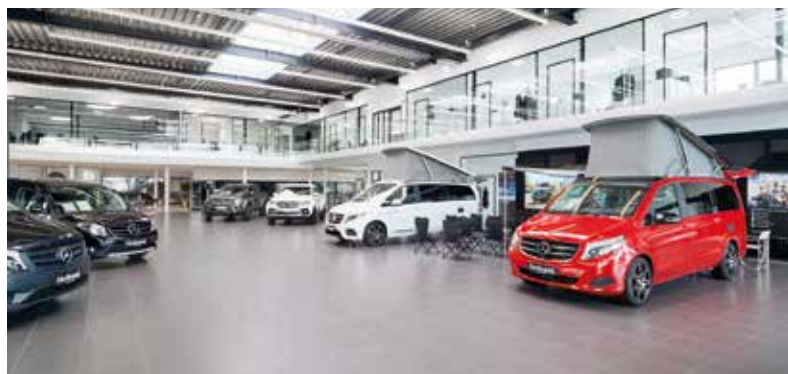
Der 800 m 2 große Schauraum bietet viel Platz für Vans, Transporter und Reisemobile.